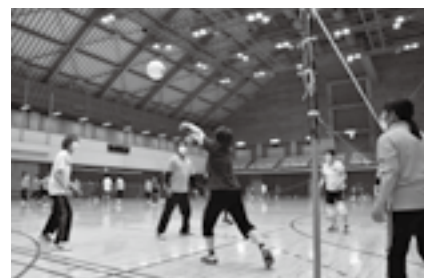
仲間へボールをつなぐ

※1人でも参加できます。申し込みは10 月3日(月)までに市スポーツ推進委員連 絡協議会事務局(スポーツ振興課・☎ 20-1584)へ。