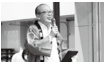
成田楽市×鶴マルシェで(23日)