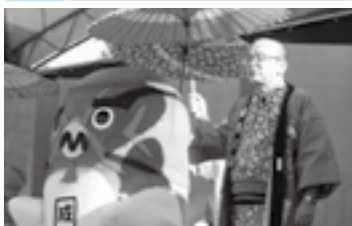
舞台上で口上を述べる(29日)