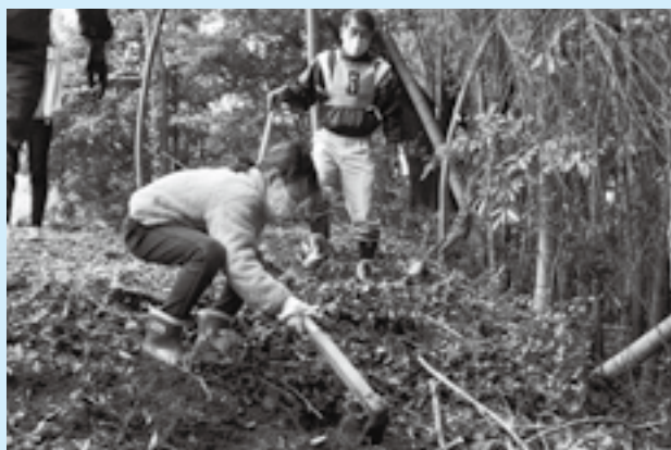
しっかりと根元を狙って

旬の食べ物を収穫して自然の恵みを感じてもらおうと「親子たけのこ掘りと竹細工教室」が八生公民館で開かれました。前日までの雨の影響で竹細工教室は中止となりましたが、天候が回復したこの日、8組の親子がタケノコ掘りに挑戦。地元のボランティアに掘り方のコツを教わると、くわを上手にを使ってさまざまな大きさのタケノコを収穫しました。タケノコをたくさん持ち帰った親子は「家族で食べるのが楽しみ」と話していました。