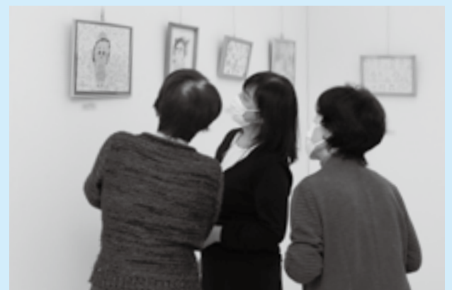
作品にじっくりと見入る

障がいのある人たちの活動を知ってもらおうと「青い麦の子作品展」がもりんぴあこうづで行われました。毎年春に開催されるこの展示。会場には絵画や貼り絵など色とりどりの作品45点が並びました。訪れた人たちは作品のモチーフや制作方法などに興味を寄せ「鮮やかできれい。とても細かく作られている」と話し、繊細な作品の世界観に見入っていました。