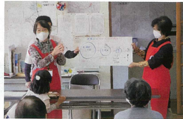
感染症対策の普及啓発活動

感染防止対策を徹底したうえで、地域への貢献や、医療従事者への支援活動を実施しました。