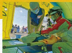
傷病者の手当をする医療救護班 (航空機事故消火救難訓練)