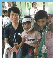
海外赤十字社 救急法普及支援事業 ※写真は平成30年度のもの