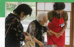
高齢者サロンの運営