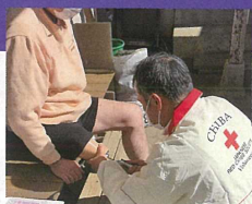
訪問先での義足の調整