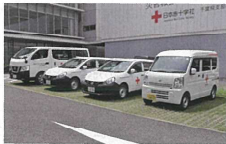
地区・分区用赤十字車両