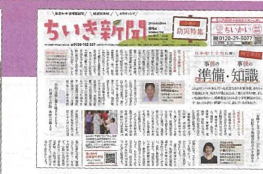
「ちいき新聞」(防災特集号) 広報紙「赤十字NOW」