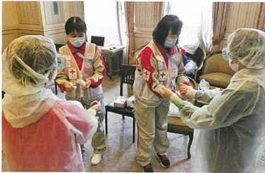
軽症者療養施設への医療教護班派遣

新型コロナウイルス感染症発生当初から、必要とされる現場で医療支援を実施しました。