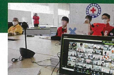
オンライン国際交流会への参加