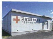
災害救援物資保管倉庫