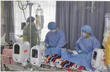
成田赤十字病院における受け入れ対応