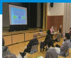
健康生活支援講習