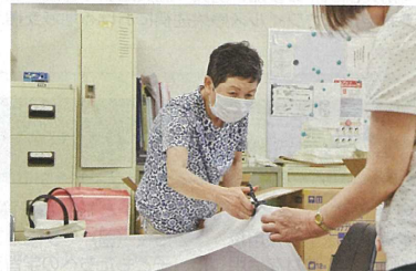
医療従事者向け資材の作製

皆様のご支援により、大規模災害に備えるための救護装備を整備することができました。また、被災者にお届けする救援物資を、県内9か所にある支部拠点倉庫に備蓄しています。