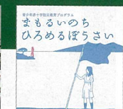
防災教育教材 「まわるいのち ひるめるぼうさい」