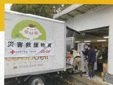
救援物資運搬訓練