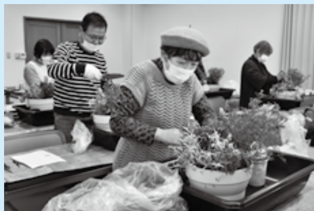
土を入れて植物の高さを合わせる

気軽に緑に触れてガーデニングを楽しんでもらおうと「市体育館の園芸教室」が開催されました。参加者は1つの鉢にさまざまな種類の植物を植える寄せ植えに挑戦。鉢の中で一緒に成長しやすいように、開花時期や生育環境が似た植物を選ぶと、色や形などの違いを生かしてバランス良く配置しました。講師から手入れ方法について説明を受けた参加者は「きれいに咲いてほしい」と話していました。