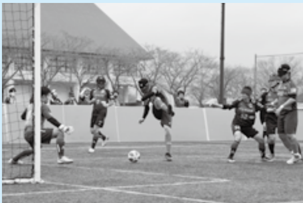
力強いシュートでゴールに迫る

ブラインドサッカーを通じて共生社会への理解を深めてもらおうと「ブラサカフェスティバル」が中台運動公園球技場で開催されました。エキシビジョンマッチには県内外の4チームが出場し、熱戦を展開。参加者が実際に競技を体験するワークショップでは、アイマスクを装着した状態で、専用のボールから出る「シャカシャカ」という音とガイド役の仲間の声を頼りに、見えない世界を体感しました。