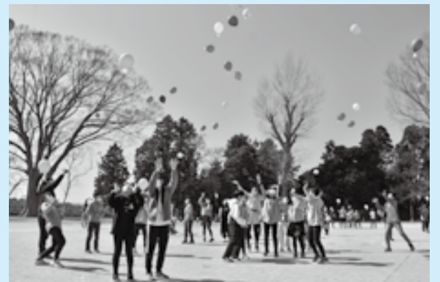
色とりどりの風船が空高く

色とりどりの風船を一齐に飛ばす「バルーンリリース」が成田小学校で行われました。6年生の卒業を記念して企画された今回の催し。あらかじめ願い事を書いた紙を風船に付けて一齐に飛ばすと、子どもたちからは拍手と歓声が沸き上がりました。催しの最後には、代表者が卒業後の抱負と将来の夢を発表し、4月からの新しい生活に向けて決意を新たにしました。