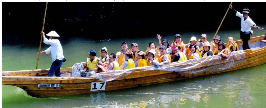
左写真： 親子療育旅行 （令和元年8月17日） 長瀬ラインくだりにて