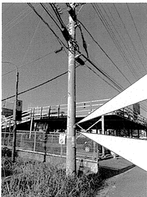
《LED化した防犯灯の様子》