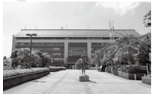
市役所本庁舎の外観