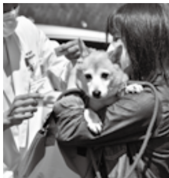
年に1回必ず受けてね