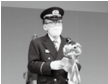
出初式であいさつ(6日)