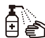
手指消毒用アルコール による消毒の励行

新型コロナワクチンの有効性・安全性などの詳しい情報については、厚生労働省ホームページの「新型コロナワクチンについて」のページをご覧ください。