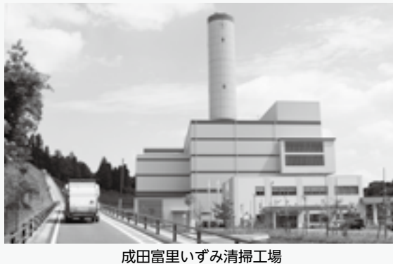
成田富里いずみ清掃工場