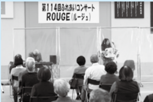
シンセサイザーとアコーディオンを弾きながら

市民の皆さんに身近に音楽を楽しんでもらおうと「ふれあいコンサート」が市役所6階大会議室で開催されました。今回行われたのは、ROUGEによるシャンソンコンサート。美しい音を奏でるシンセサイザーの音色にミュゼットアコーディオンを織り交ぜて「恋心」「黄昏のビギン」などを披露しました。シャンソン独特の音色が会場全体に広がると、観客からは拍手が沸き起こっていました。