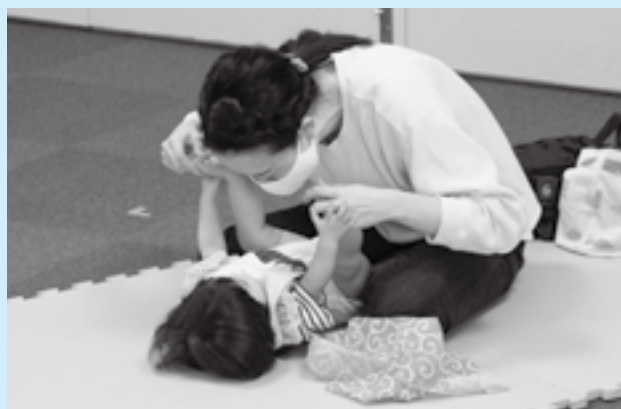
お母さんと見つめ合いながら

市立図書館で「0・1歳のおはなしかい」が行われました。毎月実施されているこのイベントは、司書が絵本を読み聞かせたり、親子で楽しめるわらべ歌を紹介したりするもの。参加した親子は司書の手本を見ながら、歌に合わせて子どもの顔や体に触れて楽しむわらべ歌に挑戦しました。リズムに合わせて頬や足を触られると、子どもたちは声を上げて笑い、お母さんとの触れ合いを楽しんでいました。