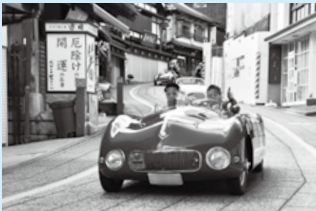
時代を超えてさっそうと

国内外のクラシックカーが4日間で5つの県をまたいで走り、タイムの正確さを競う「ラ・フェスタ・ミッレミア」。思わず目を引くさまざまな参加車が、沿道からの声援を受けながら門前町の名残をとどめる表参道を抜け、チェックポイントである成田山新勝寺に到着しました。1台1台に対して行われる交通安全祈願は成田ならではの光景。往年の名車を乗りこなすドライバーたちは、手を振りながら次の目的地へ向かいました。