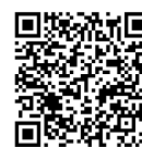
厚生労働省 ホームページ

詳細は厚生労働省ホームページ( https://www.mhlw.go.jp/stf/seisakunitsuite/bunya/vaccine_yuukousei_anzensei.html )で確認できます。