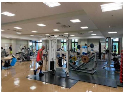
トレーニング室における 練習風景

来成したアスリートは7名、コーチやスタッフ等5名。公開練習は25日に実施。見学者は約50名。