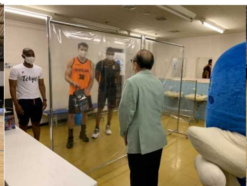
市長によるチーム激励の様子