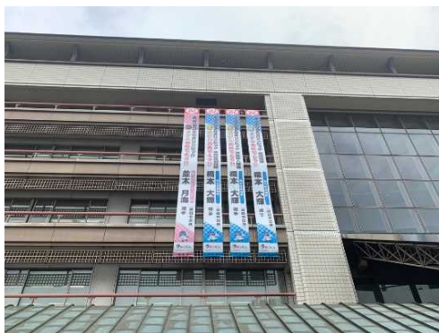
懸垂幕などの掲出