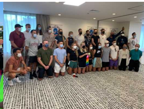
市内の中学校から千羽鶴をもらい、 チームから中学校へ、お礼の メッセージ動画を撮影