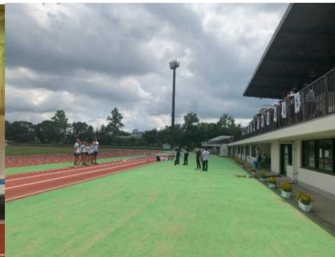
公開練習後、スタンドの観客のため 集合写真に応じている様子