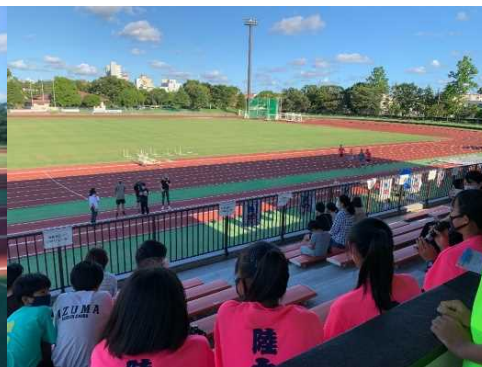
公開練習時のQAコーナー