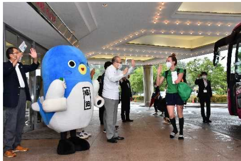
ホテルにおける歓迎の様子

その他にも、ポール・カヴァナ駐日アイルランド大使なども参加した、駐日アイルランド商工会議所主催のオンライン激励会にて、様々な関係者とともにチームを激励したほか、ホテルにおいても直接チームを激励した。