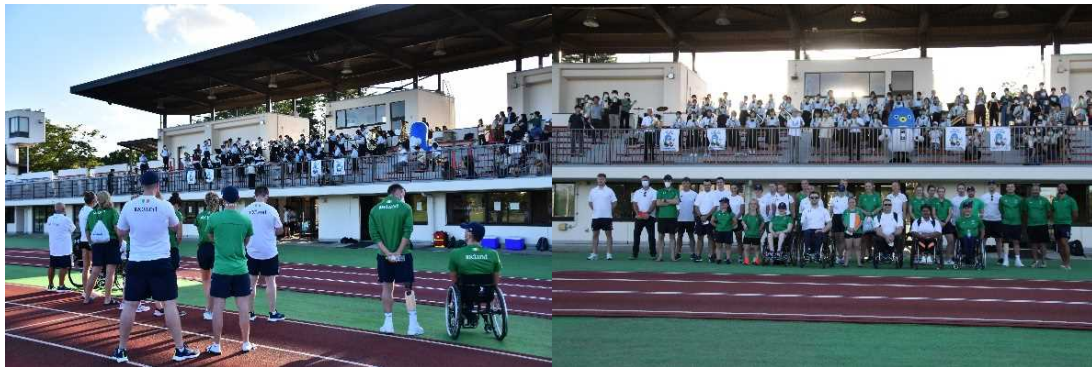
公津の杜中学校吹奏楽部による演奏