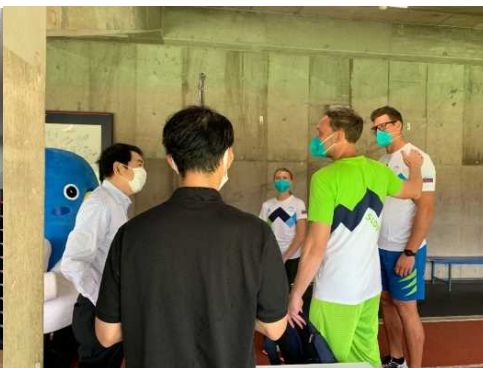
副市長による チーム激励の様子