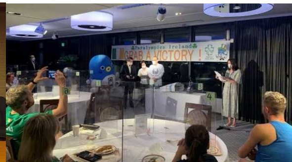
ホテルにおける激励の様子