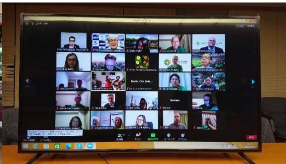
在日アイルランド商工会議所主催 オンライン激励会