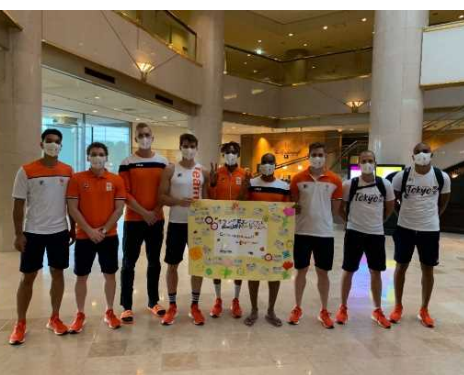
市内の小学校から応援メッセージをもらい、チームから小学校へ、お礼のメッセージ動画を撮影