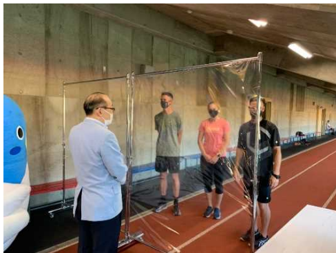
市長によるチーム激励の様子

来成したアスリートは18名、コーチやスタッフ等7名。公開練習は24日に実施。見学者は約80名。