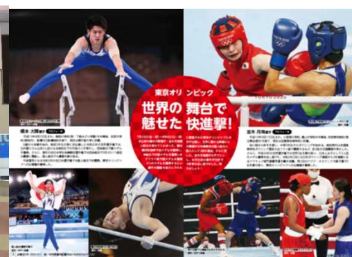
広報なりたの特集ページ