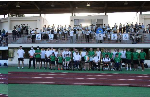
激励会後の集合写真