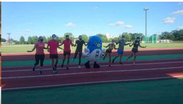
アスリートからのリクエストによる うなりくんととの集合写真