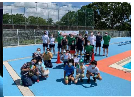
水泳チームの公開練習 (距離をとったうえでの集合写真)