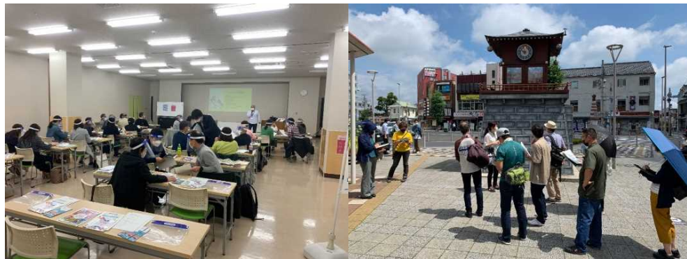
第1回エリア別研修(座学)の様子

成田市内エリア都市ボランティアの最終登録人数126名。代替事業の参加者は39名(都市ボランティア体験プログラムに参加予定だった中高生含む)。