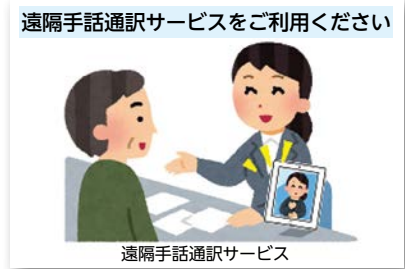
遠隔手話通訳サービス 墨田区ホームページより

算で6億円の補正予算を計上し、遠隔手話通訳サービスの初年度経費、広報経費等の補助を行っている。成田市において、遠隔手話通訳サービスを導入する考えは。