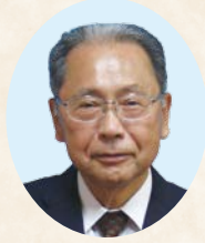
秋山 忍 議員 【議員在職20年】