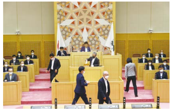
議長・副議長選挙

(注1)専決処分…本来は議会が議決しなければならない事件を、時間的に議会の招集を待てない緊急な場合などに、行政運営の遅れや滞りを防ぐため、例外的に市長が議会の議決に代わり意思決定すること。なお、時間的に議会の招集を待てない場合などの専決処分では、議会への報告と、議会の承認が必要となる。