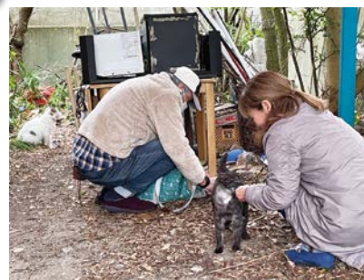
飼い主のいない猫愛護員の活動