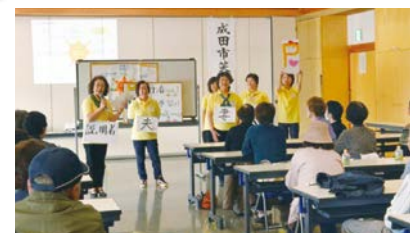
笑医プロジェクト事業(平成26年撮影)