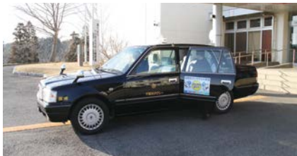
通院や買い物等に便利なオンデマンド交通

〔注3〕オンデマンド交通…利用者の予約に応じて運行する乗り合い型の公共交通サービス。