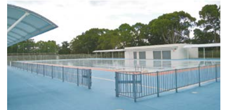
中台運動公園水泳プール

利用者や利用時間の制限、定員を設けるなど、感染症拡大防止対策を実施した上で、開場することとしました。