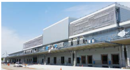
建設工事中新市場

〔注4〕リース方式…民間が資金調達から公共施設の設計・建設、維持管理などの業務をトータルで行い、そのサービス対価をリース料として受け取る契約の仕組み。