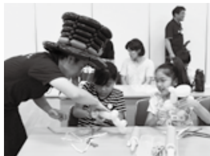
作り方を教えてもらおう

※申し込みは7月20日(火)～8月18日(水)に三里塚コミュニティセンター(☎40-4880、8月9日を除く月曜日、8月10日(火)は休館)へ。