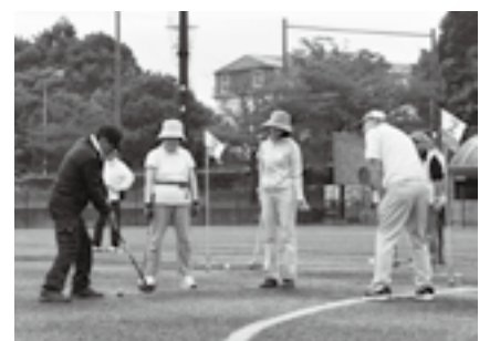
打ち方を教わりながら

日時 =9月1日(水)・3日(金)・6日(月)・13日(月)・16日(木)・22日(水)・24日(金)・27日(月)・10月4日(月)・12日(火)・15日(金)・18日(月)・22日(金)・26日(火)(予備日10月28日(木)(全14回) 午前9時30分～11時30分) 会場 =中台運動公園球技場(9月1日は市体育館) 対象 =市内在住で全回参加できる人 定員 =80人(応募者多数は初心者を優先に抽選) 参加費 =1,000円(テキスト代など) 申込方法 =8月14日(土)(必着)までに往復はがきに住所・氏名(ふりがな)・生年月日・性別・電話番号・経験の有無・用具の有無を書いて市スポーツ協会事務局(〒286-0015 中台5-2)へ ※返信用の宛名も記載してください。くわしくは同事務局(☎33-3811)へ。