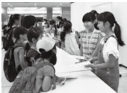
ハローワークで仕事をゲット