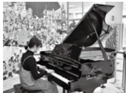
グランドピアノの迫力を体験

※18歳以下は保護者の同意、中学生以下は保護者の同伴が必要です。申し込みはもりんぴあこうづ(☎27-5252、第4日曜日は休館)へ。