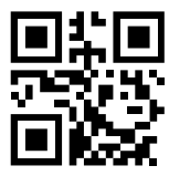
なりたメール配信サービス