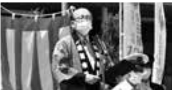
開業120周年を祝う(30日)