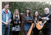
Classic Harmony 【アイルランド】

アイルランドで日本文化を紹介する団体 "Experience Japan"と活動する和太鼓チーム。 アイルランドの大学生、中高生を中心に活躍。