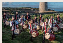
Experience Japan Taiko Team 【アイルランド】