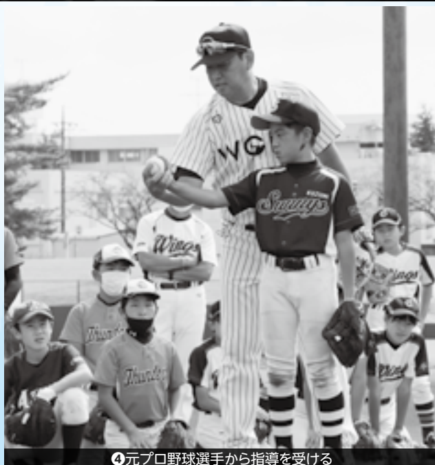
④元プロ野球選手から指導を受ける