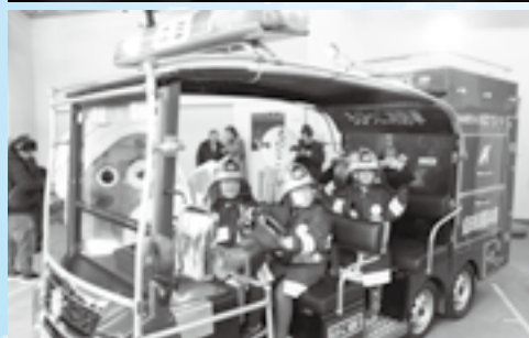
①消防車に乗り込む子どもたち