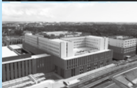
②国際医療福祉大学の付属病院として畑ヶ田に開院