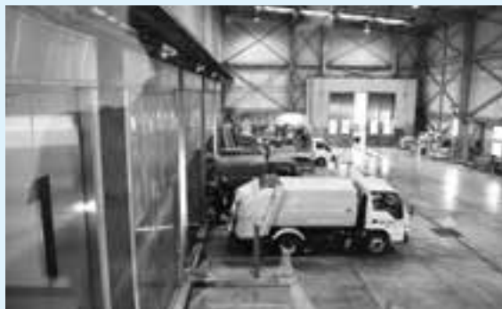
いずみ清掃工場にごみが集まる