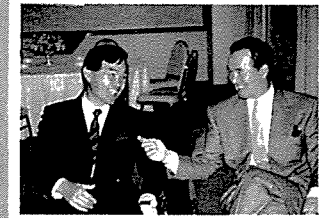
1969 新東京国際空港公団入社。

1986 長嶋 茂雄理事長のもとに発足した花と緑の農芸財団設立に携わる 中央大学時代(昭和40年~44年)は、学生運動とベトナム戦争の真っただ中でした。この時、南ベトナムの留学生支援をつうじて、現在「花と緑の運動」をしている素晴らしい仲間と出会い、以来50年共に活動をしています。