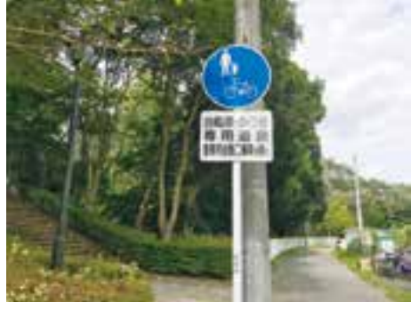
この標識の道路は乗り入れ禁止