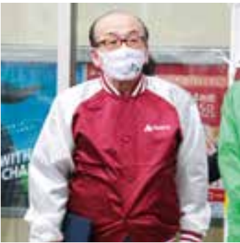
キャンペーンで呼び掛ける(12日)