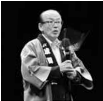
イベントを盛り上げる(20日)