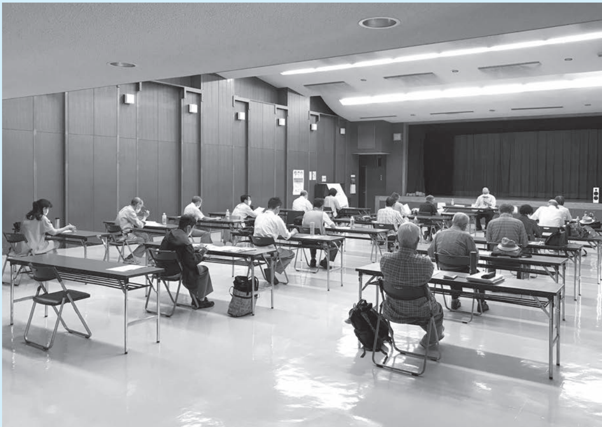
消費生活モニター会議の様様(ソーシャルディスタンスに配慮して開催しています)

成田市消費生活モニターは、消費者の代表であると同時に、消費者と行政との間のパイプ役です。モニターの役割は、月1回の会議で習得した知識・情報を、日常の活動を通じて広く市民の皆さまに伝えていただくとともに、自身や皆さまの消費生活に関する意見や情報等を市に伝えていただくことです。