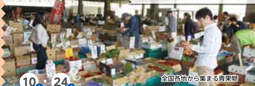
全国各地から集まる青果物