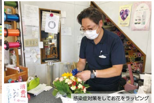
感染症対策をしてお花をラッピング