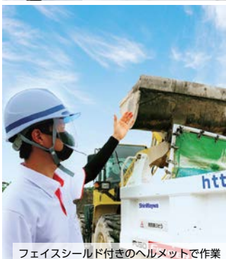
フェイスシールド付きのヘルメットで作業