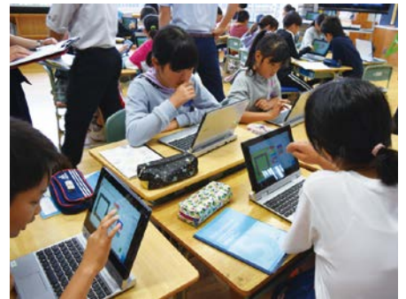
タブレット端末を使った授業(令和元年撮影)

災害や感染症の発生等による学校の臨時休業等の緊急時においても、ICT (注8) の活用で、全ての子どもたちの学びを保障できる環境を実現することを目的に、国がGIGAスクール構想の加速を決定したことを受け、児童生徒用、教師用を合わせて約1万2千台の端末機器を購入し、校内LAN回線を10ギガバイトに増強します。