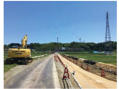
工事中の伊能吉岡線

A 地質調査において荷重を軽減する必要があるという結果であったため、タイヤによる重さなどの輪荷重を軽減でき、また、大栄みらい学園の開校に合わせて、短い工期で施工が可能な軽量盛土工法が最適であると判断し選定した。