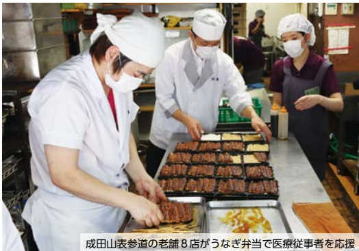
成田山表参道の老舗8店がうなぎ弁当で医療従事者を応援