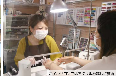
ネイルサロンではアクリル板越しに施術