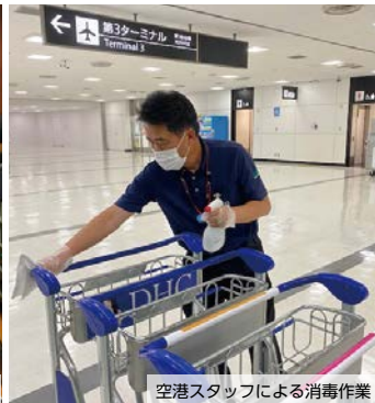
空港スタッフによる消毒作業