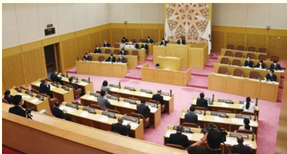
出席者を必要最小限に

また、4月臨時会に引き続き、会議中のマスクの着用、会議への出席者の調整、換気や手指消毒の徹底など、密閉・密集・密接の「3つの密」をできる限り避けた議会運営を行いました。