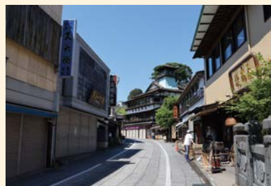
令和2年5月時点の成田山表参道