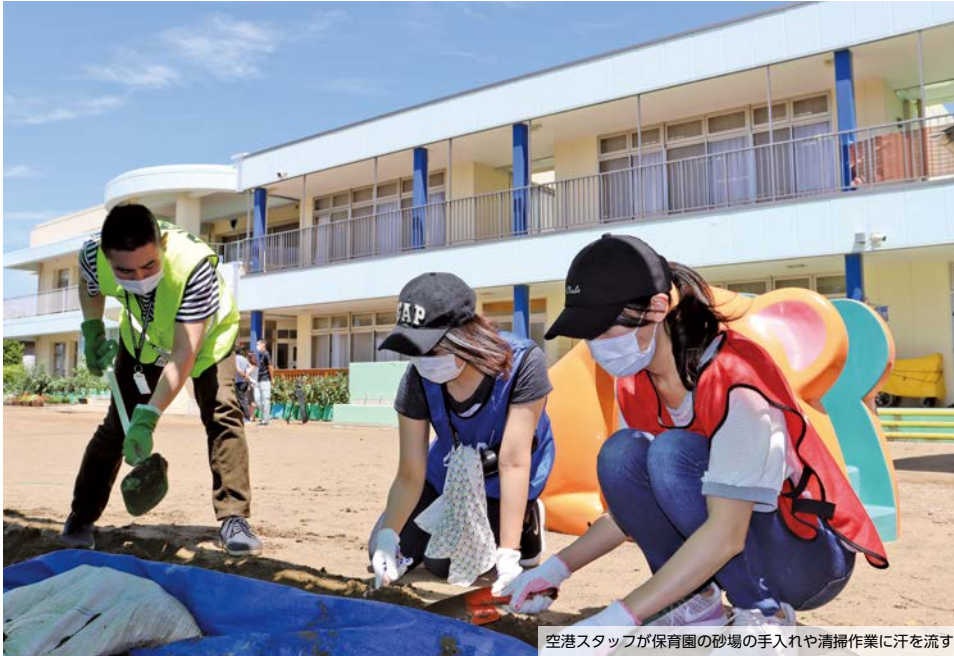
空港スタッフが保育園の砂場の手入れや清掃作業に汗を流す