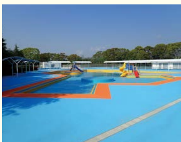
中台運動公園水泳プール

A どのような形であれば開場できるか議論したが、監視員等の多くは大学生や高校生が担っており、夏休みの減少によってスタッフ等の人材確保ができない点、3密対策の徹底が十分にできない点から、今シーズンの開場を見合わせた。