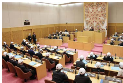
防災用ヘルメットの着脱訓練

災害対応への意識づくりと的確な行動を速やかに行うために、議会BCPの対象とする災害を想定した議会防災訓練を実施しています。また、議会BCPを効果的・効率的に運用するため、通信手段、会議室等の代わりとなる施設、水や食料等の備蓄品の確保について、環境を整備していきます。