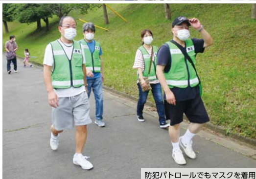
防犯パトロールでもマスクを着用