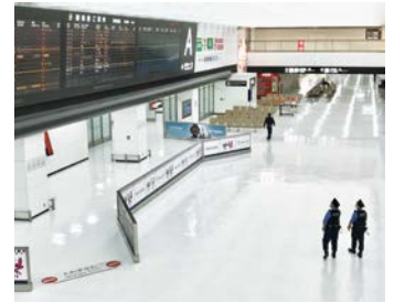
令和2年6月時点の成田空港

6月25日に国土交通省、6月26日に千葉県庁と成田国際空港株式会社を訪問し、成田空港に係る新型コロナウイルス感染症への対策が図られ、騒音対策、地域振興策とともに更なる機能強化が着実に推進されるよう求める要望書を提出しました。