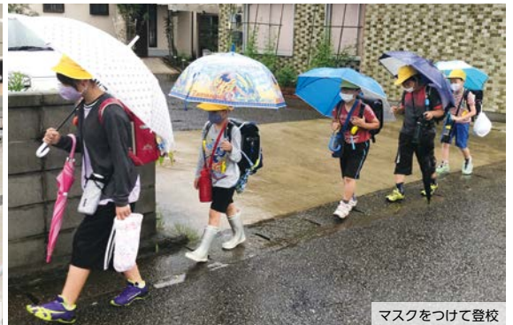
マスクをつけて登校