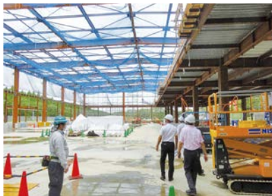
新生成田市場の建設現場を視察

本体棟の工事は基礎工事と青果棟の鉄骨の建て方が完了し、高機能物流棟の建て方を進めており、全行程の出来高は約30%とのことでした。