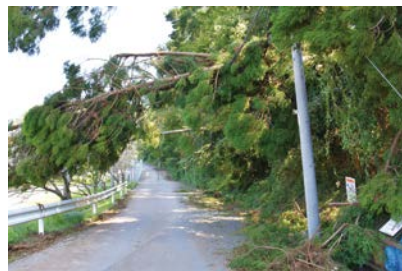
令和元年の台風15号による被害

そのため、市災害対策本部等と連携を図り、速やかでスムーズな災害対策業務に協力し、 議会・議員がどのように行動すべきか、共通の認識を持つこと などを目的として、議会BCPを策定しました。