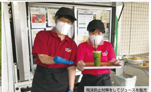
飛沫防止対策をしてジュースを販売