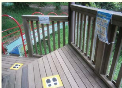
坂田ヶ池総合公園での感染症対策

A 坂田ヶ池総合公園では一部施設の利用を休止しているため、ゴールデンウィークは前年比で約26%の利用状況であったが、緊急事態宣言解除後は休止前の利用状況に戻りつつあると指定管理者より報告を受けている。