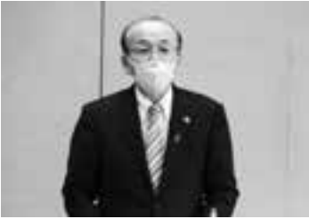
記者へ向けて説明(23日)

要となる浄化槽を転用し、住宅の敷地内に降った雨水を貯留する物：槽内清掃費を除く設置費用の2分の1(上限10万円)