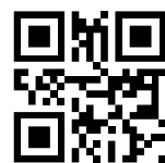
なりたメール配信サービス