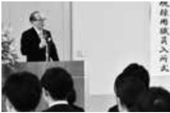
新規採用職員を激励(1日)