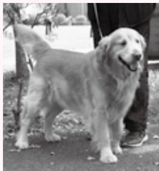
年に1回必ず受けてね