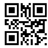
なりたメール配信サービス