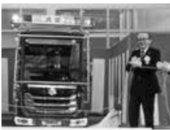
ちびっこ消防車をお披露目(23日)