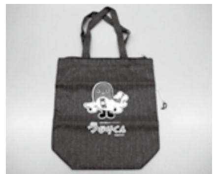
刺しゅう入りトートバッグ