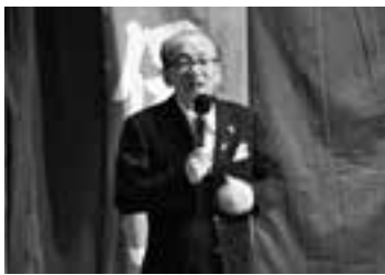
定期公演であいさつ(10日)