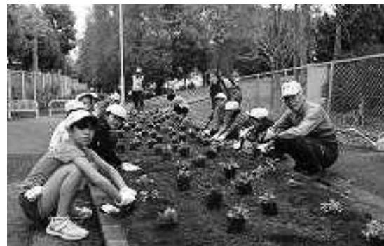
社会福祉協議会の皆さんに協力していただき、花植え活動を行っています