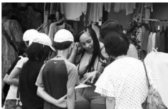
成田山参道での参道活動

自主創造を合言葉に、やさしく・かしこく・たくましく生きる成小の子の育成に向けて、学校・家庭・地域が一体となり、教育活動を進めています。令和2年度には全国造形教育研究大会を行うことになっています。本年度も校内の研究教科を図画工作科として研究を進めています。また、学習を通して児童の思考力・表現力の向上を目指した指導の工夫をすることができるよう、日々研鑽に励んでいます。成田小学校の特色ある活動としては、参道に近いという立地条件を生かし、参道を訪れた外国からのお客様と英語を使ってコミュニケーションを図る参道活動があります。また、6年生はキャリア教育の一環として「キャリアトーク」を実施しました。様々な職業の方を本校にお迎えし、それぞれの職業のやりがいや工夫、苦労などを直接聞き、将来について考えることができました。