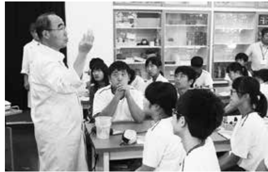
専門家によるDNA抽出の授業