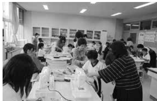
「ミシン学習」地域・保護者の協力を 得て効果的に実施しました