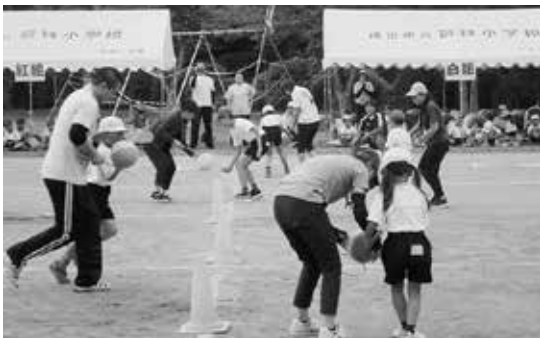
「運動会」(6月) 保護者・地域の方々とともに頑張ります

本校は、県道成田小見川鹿島港線沿線に位置し、学区の戸数は約450戸、畑作を中心とした農村地帯であり、豊かな自然に恵まれた地域です。校門近くに天にも届くような大木「あららぎ」があります。正式名を広葉杉（こうようざん）というこの木は、本校のシンボルツリーであり、本校の歴史とともに子どもたちの伸びやかな成長を見守っています。本校の教育目標は、「夢をもち 心豊かに学ぶ 実践力のある人づくりを目指してーかしこく・やさしく・たくましくー」です。特色ある教育としては、地域の施設や人材を生かした特別養護老人ホーム有楽苑、ア－アンドデイだいえいと交流やもち米作り、全校縦割り活動などがあり、これらの体験活動を通して、子どもたちに豊かな心、実践する力などを育てています。また、「知・徳・体」それぞれに具体的な目標を設定し、年間を通して共通実践を行うことで、教育課題の解決を図ることを目指しています。