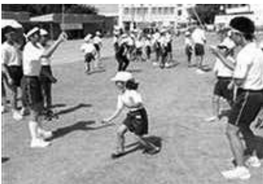
1年生から9年生までの全校体育祭

本校は、成田市で最初の施設一体型の義務教育学校として平成29年に誕生しました。義務教育9年間を見通し、途切れることのない一貫した指導方針のもと、一人一人の子どもが着実に学力を身につけ、心身ともに健全で、豊かな人間性と社会性を発揮できる人間として成長していけるよう連続した学びを実践しています。そのために、9年間を、前期(1~4学年)、中期(5~7学年)、後期(8・9学年)の3つのブロックに分け、それぞれの発達段階に応じた学習面・生活面の目標を設定して教育活動を行っています。毎日の清掃活動をはじめ、多くの教育活動の中で異学年交流を図り、「世界一仲の良い学校」として円滑な人間関係を築き生活する様子が見られます。また、全学年・全教科において協同学習を取り入れ、互いに認め、高め合える児童生徒の育成を目指しています。