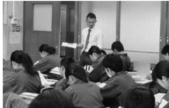
積極的なコミュニケーションを 取り入れた英語学習