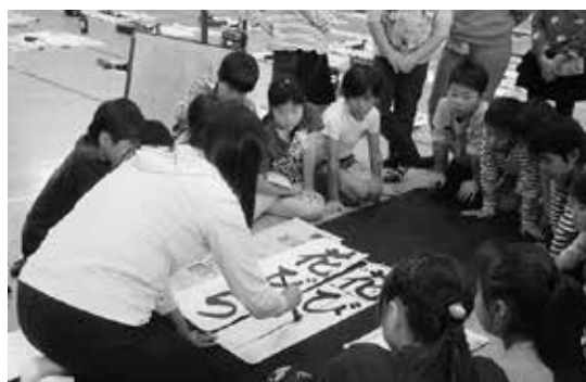
3年生から6年生まで、学年毎に体育館で書き初め教室を行いました