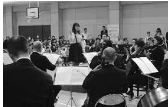
文化芸術による子供の育成事業 大阪フィルハーモニー楽団による演奏