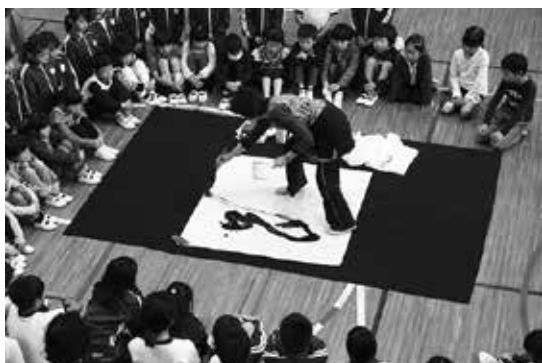
子どもたちと学校の飛躍を願って今年の文字『躍』

保護者・地域の方々には本校への関心が高く協力的です。「素敵な先輩シリーズ」と題した授業を通じて児童に貴重な体験で感動を持たせようとしています。