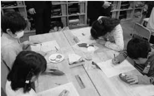
食育は丈夫に育つ源です

本年度は国語科を研究教科としていますが、昨年度まで家庭科で研究していたことを活かしながら、本校独自の「つながりの表」をもとに、横断的な教科研究を進め、児童の表現力の育成について研究・実践しています。