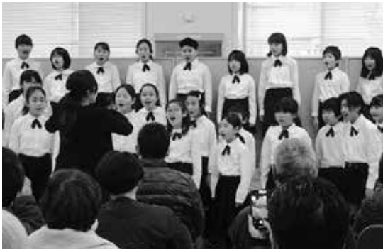
3～5年生の合唱部が成田市役所にてすてきな歌声を披露しました。

成田ニュータウンの中心部に位置する本校は、近年発展著しい飯田町・江弁須地区及び再開発による大規模マンションが建ち並ぶニュータウンの加良部地区で学区を形成し、584人の児童が在籍する大規模校です。また、病気と闘いながら勉強している子どもたちのための院内学級が日赤病院内に設置されています。全職員の活気と連帯感に満ちた和の中で、教職員一人一人の主体性や特性が活かされる組織運営を目指すとともに、学校・家庭・地域との深い信頼と連帯の中で、子ども一人一人の「生きる力」を育てています。そして、「《夢を持ち 未来を拓く》」確かな学力を身に付け、心豊かで、健康な子どもを育てる」の学校教育目標のもとで、本年度も学校・家庭・地域が一致団結して「よく遊び よく学び よく働くからべっ子」を育てています。