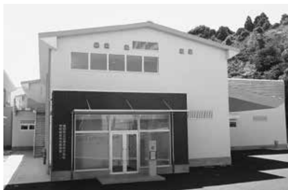
公津の杜小学校学校給食共同調理場

平成28年4月には、親子方式による3番目の施設となる公津の杜小学校学校給食共同調理場の