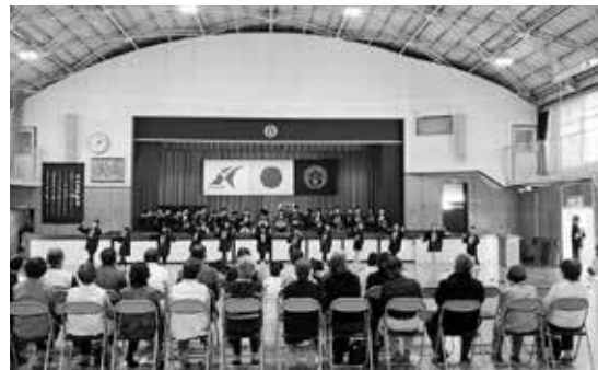
「いきいき大銀杏の会」では、地域の方々へ下座を披露しました