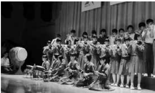
総合的な学習の時間の伝承芸能の発表