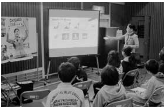
6年 総合「キャリアトーク」

「大きく 豊かに たくましく 生きる子どもの育成 -夢をかなえるための土台づくり-」を学校教育目標に、「よく考えて進んで学ぶ子」「思いやりがあり助け合う子」「丈夫でがんばりぬく子」を目指す児童像としています。本年度は研究テーマを「自己肯定感を育む道徳授業のあり方」とし、互いの違いを認め合い理解しながら、他者を尊重する態度の育成に努めています。また、地域、保護者と学校との双方向の協働をめざし、保護者の皆さまにゲストティーチャーとして授業に参加していただいたり、地域に向けて授業公開を行ったりしています。