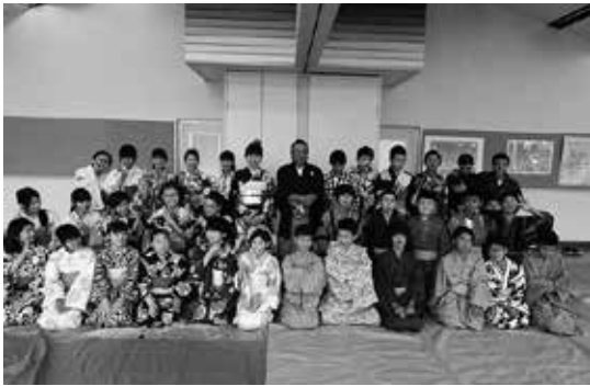
毎年恒例 1年生家庭科 浴衣着付け教室