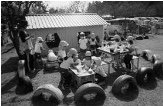
どんぐりやまつぼっくりの自然物も活用してレストランごっこに発展中

本年度は、3歳児2クラス39人・4歳児2クラス6人・5歳児2クラス2人、合計47人の新入園児を迎え6クラス143人でスタートしました。保護者と連携を取りながら、園児が健やかに明るく元気に過ごせるように職員一同、より良い幼児教育に日々努めています。