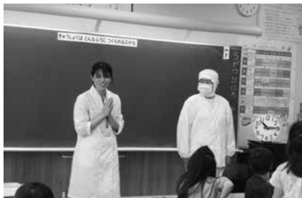
栄養教諭による食に関する指導

また、家庭教育学級や親子料理教室等で家庭に対する啓発活動、情報提供を行うことにより、家庭における食育を促しています。