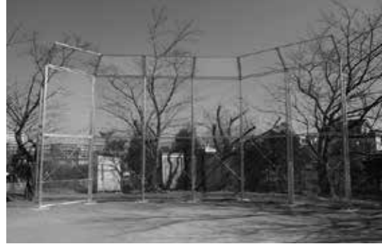
新しくなったバックネット