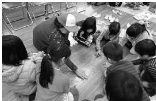
おはじきの遊び方を教わったよ！ 「昔の遊び」