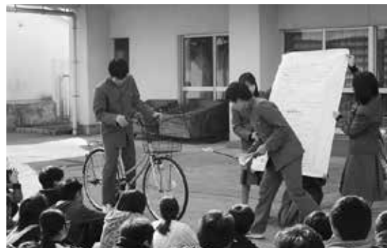
新入生の入学前に先輩達が自転車の 乗り方を教えに行きます