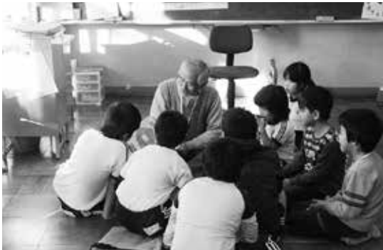
地域の方による読み聞かせ

本校は教育目標「心豊かでたくましく生きる力を身につけた児童の育成」とし、教育活動の充実に努めています。本年度も「チーム玉造」、知・徳・体の調和のとれた教育活動を推進し、「やさしく・かしこく・たくましく」を合言葉としています。特に、「玉造小スタンダード」をもとに、学習のしつけや家庭学習を習慣化することで基礎基本の定着を図っています。また、LD・ADHD等通級指導教室「スマイル」を活用して、一人一人の教育的ニーズに応じた適切な支援を充実させています。そのほか、縦割り班活動や縦割り清掃に取り組んだり、地域の方に読み聞かせや書き初めの指導をしていただいたりして、異学年や地域の方との交流を深めています。