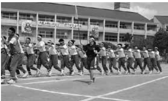
体育祭 キャリアの視点【人間関係形成能力】

学校と家庭との連携については、4月に教育課程説明会を開催して学校経営方針の理解に努め、また7月には、PTA主催で教師と保護者の語らいの場「西中の夕べ」を行ったりしています。本年度も本校の教育目標である「たくましく生きる、心豊かな生徒の育成」の具現化に向け、学校・家庭・地域が一体となった教育活動を更に推進していきます。