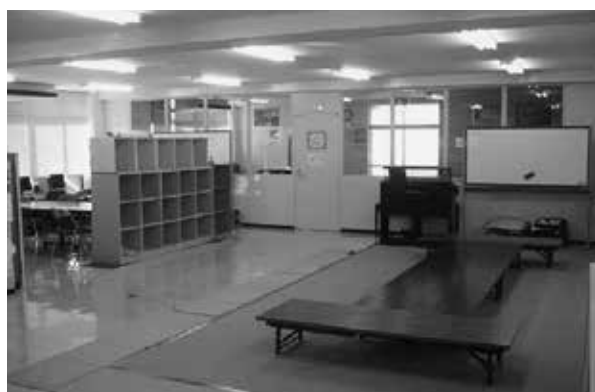
教育支援センター「ふれあいるーむ21」