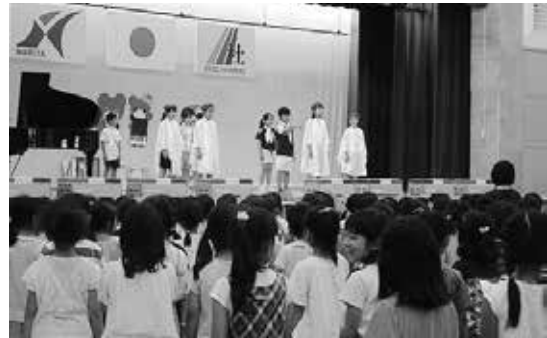
音楽集会 歌声が響く学校です