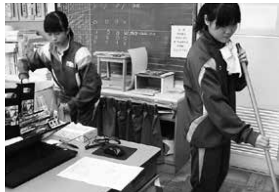
1～3年生による縦割り清掃風景