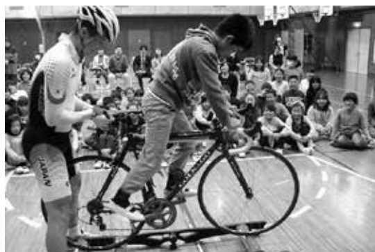
パラリンピックメダリストと特別授業