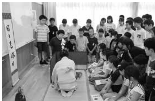
日本の伝統文化体験として、お茶をたてる体験をしました