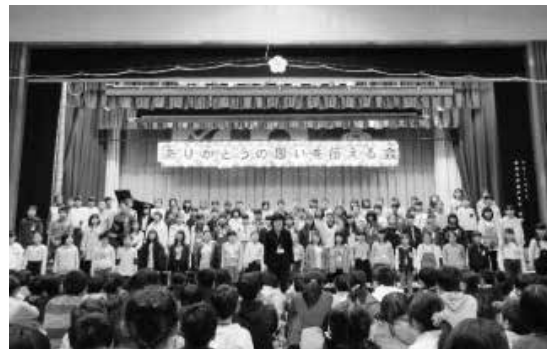
ありがとうの思いを伝える会