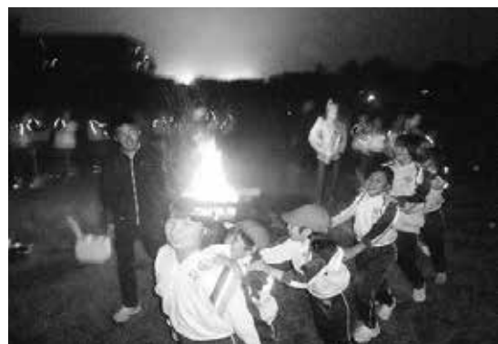
5・7年生の小見川宿泊学習