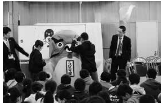
6年生総合的な学習の時間 Pride of NARITA