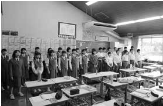
響き渡る歌声 充実した歌声活動

また、授業では、「わかる授業」「楽しい授業」のために生徒の視点に立った指導方法の工夫改善に取り組んでいます。外国語教育において、「生きた英語力」を身につけさせるため、ALTを積極的に活用したコミュニケーション能力を高める授業づくり、数学科においては、少人数やティーム・ティーチングを取り入れたきめ細かな指導方法の工夫改善に取り組み、子どもたちの学力の向上を目指しています。