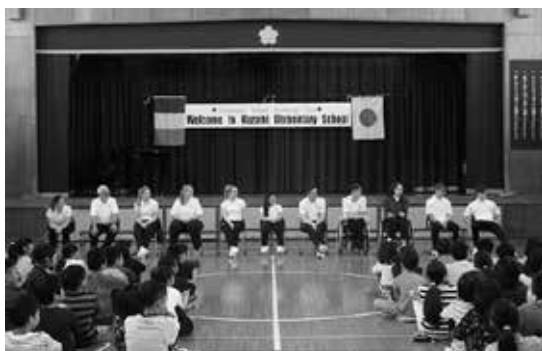
アイルランド・パラ水泳チームの選手と交流しました

本年度もオリンピック・パラリンピックを活用した教育に取り組み、自国の文化や伝統に対する理解を図るとともに、外国人とコミュニケーションを取り、国際交流活動の充実に努めています。