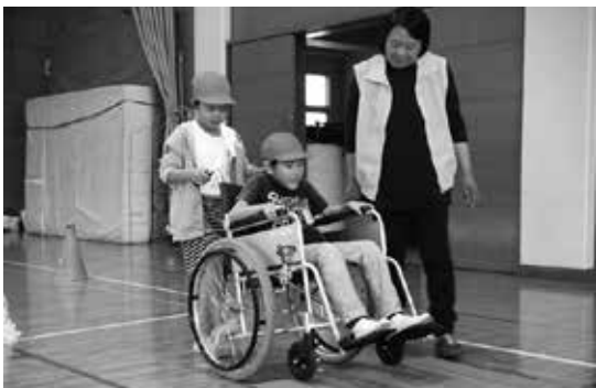
車いすって不安だね！ 「福祉疑似体験」

本城という地区名は、この地を開発して住み着いた人々が、自分たちの本当の根城にしようという願いを込めて付けたと言われてしています。学区住民は地域の学校としての意識が強く教育熱心であり、学校教育に対する強い期待を持ち、協力的です。『夢と希望を笑顔で語る子どもたち』を合言葉に、一人一人の児童が充実した楽しい学校生活を送ることができるよう、学校と家庭、地域の連携を密にして、学校教育目標「たくましく、心豊かな子どもの育成」に努めています。本年度は、(1)心の教育、規範意識の醸成及びあいさつの実践(2)具体的な学力向上策を講じるとともに読書活動や日記の奨励と家庭学習の充実(3)体力向上と基本的生活習慣の定着を重点事項として取り組んでいます。また、民生委員による「交通指導・挨拶運動」・社会福祉協議会による「福祉疑似体験」において地域との連携を図り、「昔の遊び」等の活動を通して、人間関係づくりと豊かな心の育成を図っています。