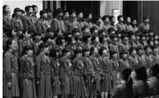
3年生を送る会 感謝の思いを込めた大合唱