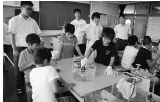
夏休みに成田北高校の先生を講師に招いて「おもしろ実験室」を行っています