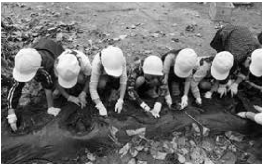
たくさんとれたよ！ ベニアズマ

本年度、学校教育目標を「未来を切り拓く かしこく 心豊かで たくましい児童の育成」とし、学校経営の重点を「確かな学力の向上」「豊かな心の涵養」「健やかな体の育成」「地域とともに歩む学校づくり」「チーム大須賀の学校力の向上」と定め、「一人一人が輝く大須賀小学校」を目指して取り組んでいます。本校の学区は、伊能、奈土地区を中心に9つのブロックで成り立ち、歴史的にも古く、特に伊能地区には由緒ある神社仏閣が点在しています。「伊能歌舞伎」は市指定無形民俗文化財であり、保存会・後援会の方から、子どもたちが歴史や所作などを学んでいます。昨年の成田伝統芸能まつりでは、6年児童がこども歌舞伎を披露し、11月の伊能歌舞伎講演会には、4・6年児童が参加しました。地域の青少年相談員との連携も意欲的であり、その精力的な指導により、昨年度は成田市青少年交流綱引き大会でベスト4に輝きました。