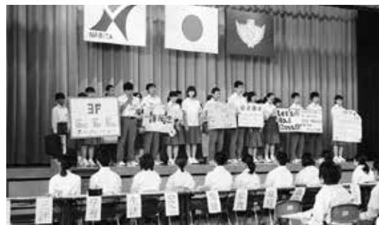
生徒総会 キャリアの視点【課題対応能力】