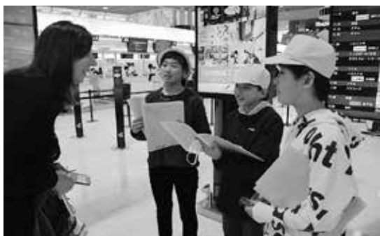
「世界を目指せ！ 津富浦っ子イングリッシュ大作戦」

学校教育目標「自ら学び、心豊かにたくましく生きる児童の育成」のもと、道徳科を研究教科として位置づけ、ともに学び、高め合う喜びを見出すことのできる児童を育てようと努めています。また、読書タイムやドリルタイム、相互授業参観等、児童の基礎学力向上や教師の授業力向上に向けた取組に力を入れています。また、令和2年度の閉校事業に向け、総合的な学習の時間を活用して、生まれ育った地域を新たな視点で見つめ直したり、空港を教材にした「異文化理解」「安全教育」「福祉教育」「環境教育」の計画を立てたりし、地域愛を深める学習活動にも工夫して取り組んでいます。さらに、学校支援ボランティアや社会福祉協議会の方の協力のもと、読み聞かせ、生活科・家庭科・校外学習時の安全指導、グラウンド・ゴルフやしめ縄作りなど、地域の方との交流の場を積極的に設定し、地域社会とともに、児童の育成に努めています。