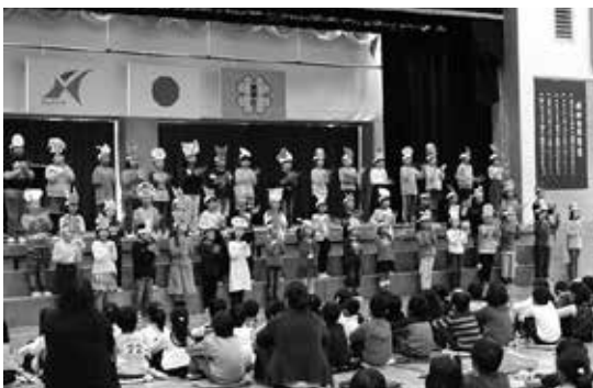
「音楽ランド」 全校で音楽を楽しみました

昨年度から取り組み始めた学校支援地域本部事業により、地域の教育資源の活用を図りながら「昔遊び活動」「さつまいも作り・野菜作り」「車いす体験」「米作り」「読み聞かせ」「ミシン指導」など多くの体験活動を充実させることができている。また、地域の方との交流を通じて優しさや感謝の心、豊かな人間性も育んでいます。