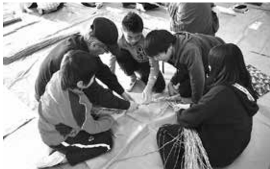
地域の方としめ縄作り