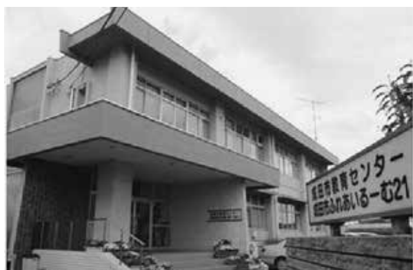
教育センター・教育支援センター

また、担当指導主事、指導員の学校訪問等により、各学校との連携を密にし、通所する児童生徒一人一人の学校復帰の足がかりとします。