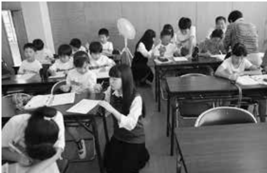
地域の学習ボランティアの方による「神小寺子屋」が始業前に開催されています

創立35周年を迎える本校は、成田ニュータウン北部にあり、近くには、成田スカイアクセスの成田湯川駅があります。保護者は全国各地から移り住んできていることから、新たなふるさとづくりを目指して「神宮寺まつり」「どんど焼き」などの文化活動や各種スポーツ大会など独自の行事が定着してきました。保護者の教育的関心は高く、読み聞かせ・環境美化・リサイクル活動・防犯パトロール活動などのPTA活動も盛んです。また、隣接する成田北高校の先生や生徒によるおもしろ実験教室や、綱引き練習などの交流を行ったり、地域の学習ボランティアによる学習会「神小寺子屋」を毎朝開催したりするなど、学校・家庭・地域との交流が盛んです。このような地域環境の中、「心豊かでたくましく実践力のある児童の育成」の学校教育目標のもとに、「知・徳・体の調和」を図り「よく学び、よく遊べ、感動いっぱい」の神宮寺小」を合言葉に全教職員が力を合わせて学校教育活動に取り組んでいます。