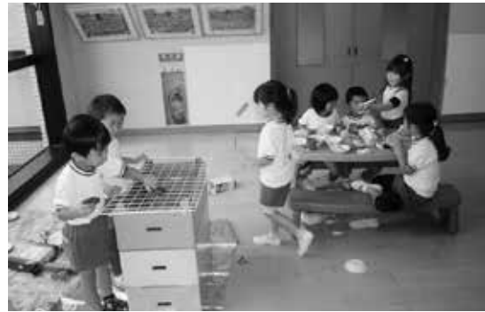
網をヒントに主体的にバーベキュー 「もうすぐお肉も焼けるね！」