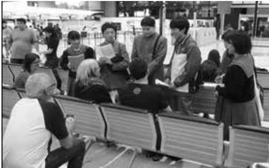
空港インタビュー 通じる？…英語の力試し

明るく活動的な生徒たちは、志を高くもち、目標に向かって毎日努力し、心身共に鍛えています。