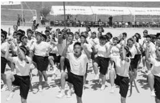
体育祭 応援にも熱が入る

学校教育目標は「次代をひらき、心豊かにたくましく、生きる力を身に付けた生徒の育成」であり、知・徳・体の調和のとれた人間性豊かな生徒の育成を目指し、職員一同、全力で取り組んでいます。中でも、国際性や実践的なコミュニケーション能力の基礎を身に付けた生徒を育成するために、独自の教育課程を編成し、英語授業の充実を図っています。