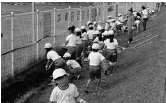
3年総合「フラワーロード整備」ゆめ協議会の皆さんと花植え活動をしています

学校教育目標を「夢を抱き たくましく 生きぬく人づくりをめざして ～知・徳・体の調和～」としました。いつでも夢や希望を抱きながら精一杯全力で頑張る児童の育成に向けて、全教職員が力を合わせて取り組んでいます。「全力でがんばる子」の育成を目指し、一生懸命努力すること、努力し続けて感動を味わわせることを目的に、運動部（陸上、綱引き）と合唱部の活動を通年行っています。また、子どもたちが夢や希望を抱きつつ、健全に成長するために地域で子どもを育て守る体制づくり（「平成小学区ゆめ協議会」本年度10年目）が推進されています。