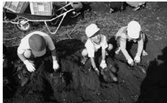
「全校芋ほり」(11月) 友達と力を合わせ、たくさん収穫します