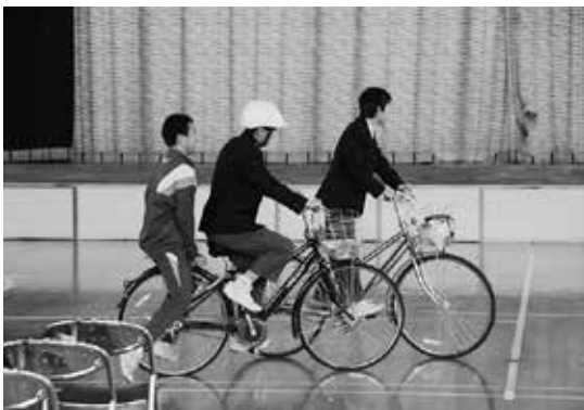
3年生による新入生への交通安全教室

本校は「確かな学力 豊かな感性 強い体を持ち 未来をたくましく生きる生徒の育成」を学校教育目標とし、その達成を目指して様々な教育活動を展開しています。また、令和3年度に予定されている義務教育学校「大栄みらい学園」(仮称)の開校に向け、本校の良き伝統を築くとともに、学区小学校・地域との連携を更に進めています。校内においても異学年交流を深めながら、生徒一人一人が何事にも一生懸命取り組むことのできる学校づくりと、学校と家庭・地域が一体となって子どもたちを育てていく「共育」を推進しています。