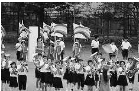
運動会の花「マーチングパレード」は、高学年が参加しています

中台地区の社会福祉協議会の協力のもと、「あいさつ運動」「ペットボトルキャップ回収運動」「花植え活動」など継続しています。本校を取り巻く環境は整っており、保護者・地域の方々の教育的な関心も高く、活発なPTA活動がなされ、防犯パトロールや読み聞かせのボランティアの皆さんからお力添えをいただいています。このような中で、花や緑いっぱいの学校、朝はグラウンドで陸上の練習、校舎からはブラスバンドの音が鳴り響き、笑顔と元気なあいさつが交わされ、授業に集中する姿が見られます。