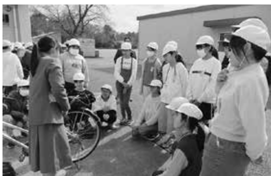
遠山中の生徒から自転車での、安全な登下校について指導してもらいました

また、遠山地区の小中学校では、小小及び小中連携を積極的に推進しており、共通の「家庭学習の手引き」、「生活の手引き」の作成・活用や、生徒指導上の課題についての情報交換などを行っています。地域の方々とも連携を図りながら、児童の育成に力を入れています。