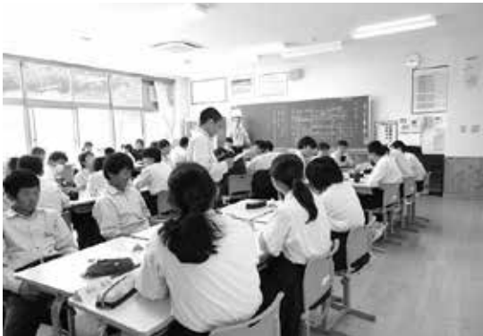
主体的な学びを促す学び合い学習

学校教育目標は、昨年度と同じ「未来を拓く心豊かでたくましい生徒の育成」です。特に本年度は、「秩序と魅力のある学校」、「安心と安全のある学校」を目指し、学び合い学習や自治的活動を推進するとともに、学校・家庭・地域の連携による健全育成に取り組んでいます。生徒が中心となって進める生徒会活動では、日頃から自分の役割を自覚し、互いに協力し合う姿が見られます。本年度は、入学式の進行を生徒が務めるなど、新たな取組に挑戦しています。