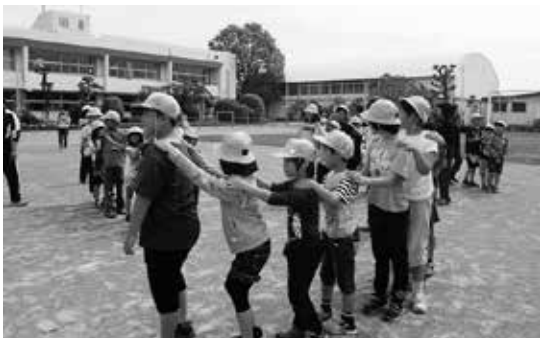
「一年生を迎える会」では、全校児童がレクで交流しました

学校教育目標「やさしく かしこく すこやかに」のもと、基本的な生活・学習習慣の確立、体力向上、家庭・地域社会との連携を重点目標に掲げ、学校全体で朝読書や詩の暗唱、計算・漢字検定、なわ跳び検定に取り組むとともに、縦割り活動や地域との交流等、小規模校のよさを生かした学校づくりを行っています。また、全校で「早寝・早起き・朝ごはん・朝うんち」運動を推進するとともに、健やかな体づくりを目指して「遊・友スポーツランキングちば」に挑戦しています。さらに、年間を通して下座の演奏にも取り組んでおり、運動会や地域の方々との交流行事、学校行事等で演奏を披露しています。本年も印旛地区小中音楽発表会での演奏を目指し、練習に励んでいます。