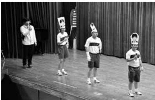
予餞会の寸劇で先生も登場して 大盛り上がりします

本校は、成田国際空港に最も近く文化と歴史を有した中学校です。本校の大きな特色は生徒の意欲と自主性を重んじ、どの行事でも生徒の意見を取り入れていることです。体育祭、合唱コンクールはもちろんですが、入学式は生徒会が司会・進行を行い、先生と生徒が一体となって新入生を心から迎えることを目的としています。地域の来賓の方や保護者からも好評を得ています。また、3学期に行われる予餞会では学年ごとに寸劇や群読、合唱などを披露し、3年生も素晴らしい合唱で1、2年生の気持ちに応えます。また、本校の通学区は広域で9割以上の生徒が自転車通学をしています。交通安全への意識を生徒自ら高めるために、入学予定の児童に対して3年生の生徒が各小学校に出向き自転車の乗り方教室を行っています。これからも歴史と伝統を受け継ぎ地域を誇れる生徒の育成に向けて日々の教育活動に取り組んでいきます。