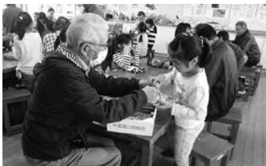
敬老会の方たちと一緒に 「昔の遊び」

本校では、学校教育目標「学ぶ意欲が高く、心身ともに健康な児童の育成 ～明日のために、今を精いっぱい生きる子どもの育成～」を達成するために、一人一人を大切にしたいきめ細かな指導を心がけ、自己肯定感を高め、人間性豊かな児童を育てようと努めています。算数をはじめとする少人数指導、基礎学力を定着させるためのチャレンジタイム、特別支援教育、生徒指導などの推進に力を入れています。また、本物の竹を使う竹馬作りや竹馬大会、流しそうめん、餅つき大会、昔の遊びなどの地域との交流を深める行事を実施し、地域の皆さんとともに歩む学校づくりをしています。また、大栄地区の小中学校の統合を見据え、5つの小学校と1つの中学校で連携を推進しています。