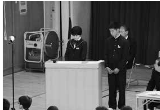
生徒が進行を務める入学式