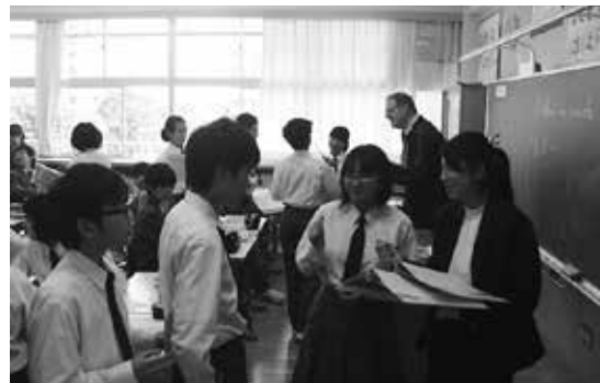
コミュニケーション能力の育成に 力を入れている英語学習