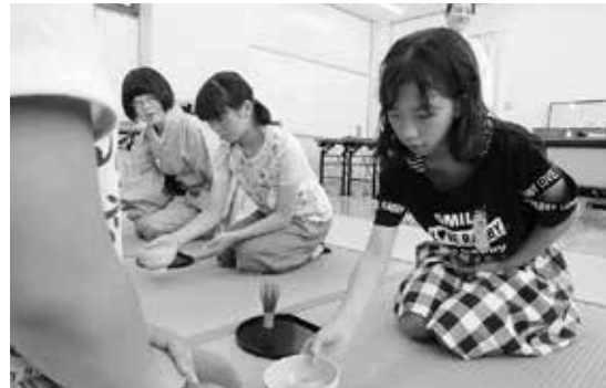
室町文化体験（茶道・華道）を行い、奥深さを肌で感じ取ることができました