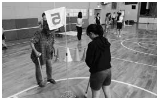
地域の方との交流 「グラウンド・ゴルフ大会」