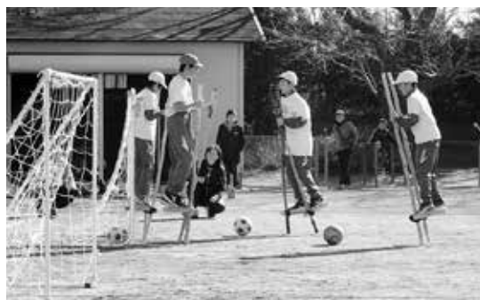
恒例の竹馬大会 竹馬でサッカーだってできます