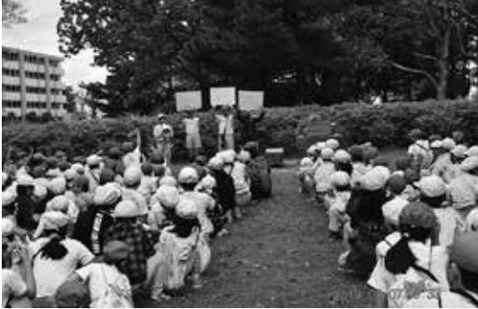
全校遠足赤坂公園

本年度は、児童数195人、通常学級6学級、特別支援学級2学級の合計8学級でスタートとなりました。学校目標に「強くて新しい学校」、「やさしい子・かしこい子・元気な子」を掲げ、「夢に向かって心豊かにたくましく生きる児童の育成」に努めています。特色ある教育活動として、思いやりやリーダー性の育成を図るため、縦割り交流活動「すすく班」での全校遠足、清掃、定期的なレク活動、縄跳び大会等、様々な取組を行っています。今年は「サインはV～何事にもあきらめず最後まで頑張る新山っ子～」を合言葉に学校づくりを進めています。