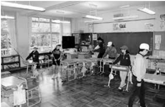
「縦割り班での清掃」 下学年に清掃の仕方を優しく教えます

本校は明治6年創立の伝統ある学校で、「心豊かで、自ら学ぶ、たくましい児童の育成」を目標に、家庭・地域との連携を図り、保護者・地域社会に信頼される学校づくりを推進しています。目指す児童像として、「思いやりのある子」「自分で考え、進んで学ぶ子」「元気でがんばりのきく子」を掲げ、命を大切に、明るい挨拶ができ、基礎・基本をしっかり身に付けた子どもたちを育成しています。特に「あかるい あいさつ じぶんから さきにおうね 公津っ子」を合言葉とする「あじさい運動」に力を入れ、いつでもどこでも自分から進んで挨拶ができる子どもたちの育成に努めています。また、全校徒歩遠足(手つなぎ歩行会)や運動遊び(杉の子タイム)や縦割り班清掃などの異学年交流(杉の子班活動)や地域との交流を年間通して計画的に行い、思いやりの心や協力性・協調性を育てています。校内研究では、児童一人一人の確かな学力の向上を目指し、算数科の研究に取り組んでいます。