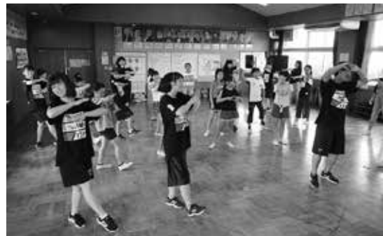
平成塾「ダンスを楽しもう！」成田国際高校ダンス部員に教えて頂きました