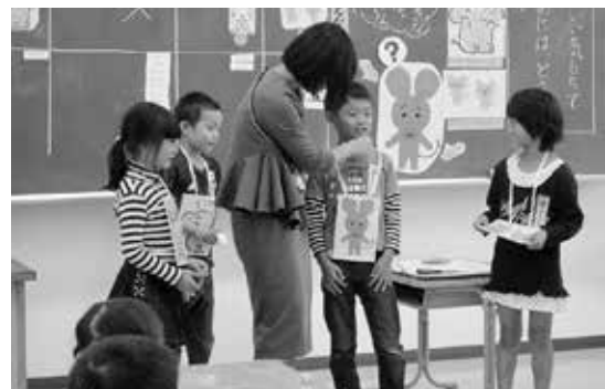
1年 道徳科「とうもろこしができた」