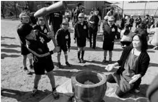
みんなで力を合わせた 全校もちつき会

また、地域の特別養護老人ホームとの交流や、社会福祉協議会との連携による花苗植え教室、グラウンド・ゴルフ、しめ縄作りなどの行事を通して、地域の方々との交流も深めています。