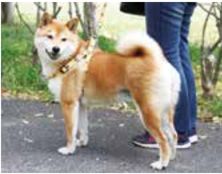
ペットは大事な家族です