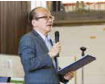
参加者の長寿を祝う(5日)