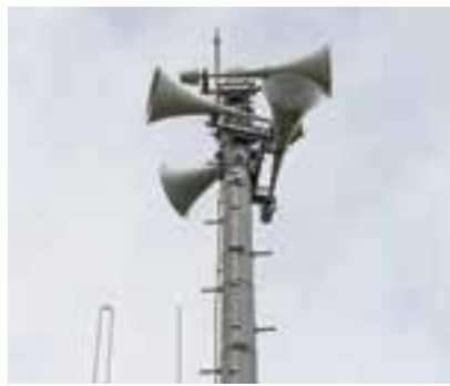
防災行政無線で放送

放送内容 1「これはJアラートのテストです(3回繰り返し)、こちらは防災なりました」、防災行政チャイム