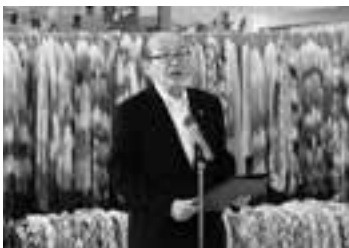
出発式であいさつ(31日)