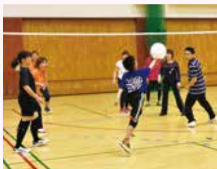
年齢に関係なく盛り上がる(うなバレー)

会場 市体育館 種目 いろいろなバレー、卓球、バドミントン、ユニカール、ポッチャ 参加費 1100円(保険料など) 持ち物 運動のできる服装、上履き、飲み物