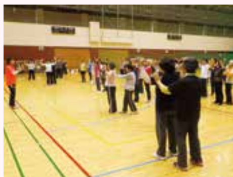
地域みんなで健康に(健康体操)

実際に活動しているクラブの体験ができます。参加を希望する人は当日直接会場へ来てください。 日時 7月13日(土) 午後1時30分～3時30分