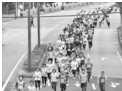
たくさんの人が参加

ボランティアスタッフにはジャンパーと弁当を用意します。 内容=選手やニュータウン内走路の安全確保 対象=中学卒業以上の人 申込方法=8月23日(金)までに成田POPラン大会事務局(スポーツ振興課・☎20-1584)へ ※くわしくは同事務局へ。