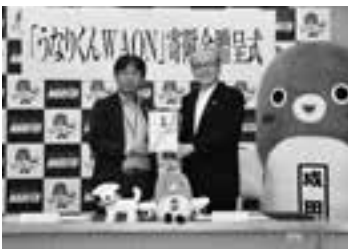
寄付金贈呈式で(17日)