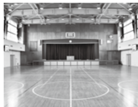
広い場所で伸び伸びと運動できます