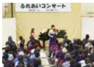
優雅な昼のひとときを

日時=3月14日(木) 午後0時10分〜0時50分 会場=市役所1階ロビー 内容=ピアノの起源といわれる楽器ハンマードルシマーとアコースティックギターのリュネ・ソネによるデュオ[Lune Sonne]による演奏 ※入場は無料です。鑑賞を希望する人は当日直接会場へ。くわしくは文化国際課(☎20-1534)へ。