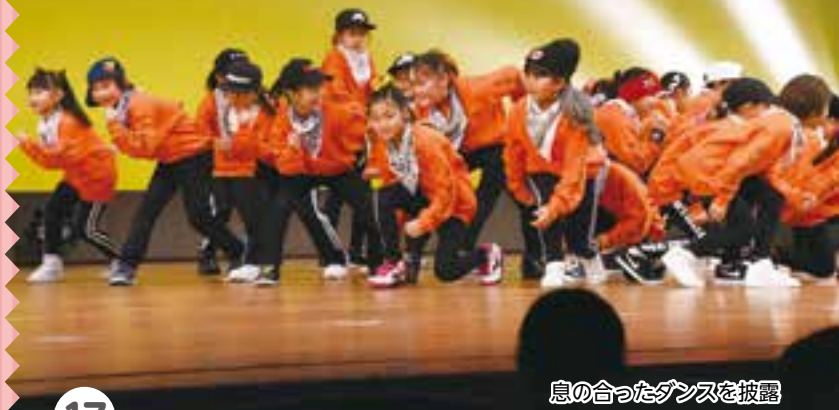
息の合ったダンスを披露