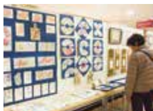
味わいのある作品を展示

日時=3月2日(土) 午前9時45分〜午後5時 会場=赤坂ふれあいセンター 内容=同センターで活動するサークルやシニア教養講座の受講生などによる舞踊・ダンス・コーラス・楽器演奏などの発表、絵画・書などの展示、茶席コーナー ※入場は無料です。くわしくは同センター(☎26-0236)へ。