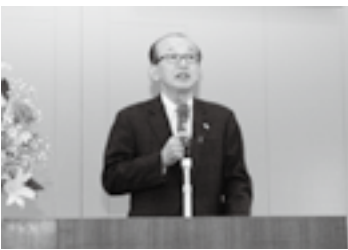
就任式であいさつ(21日)