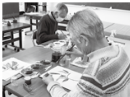
墨で濃淡を表現する

※くわしくは同館(☎26-9610、月曜日・祝日、1月15日(火)、2月12日(火)は休館)へ。