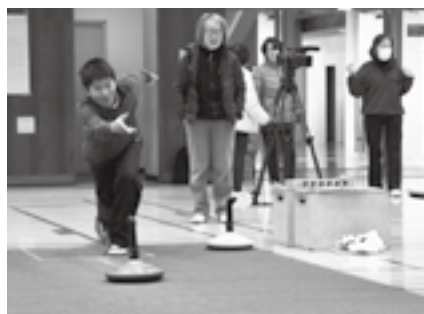
作戦を立てて投球

※初心者教室も開催します。申し込みは1月28日(月)までに市レクリエーション協会事務局(スポーツ振興課・☎20-1584)へ。