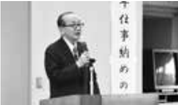
職員に向けて訓示(28日)