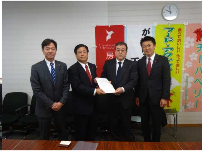
（千葉県に要望書を提出）