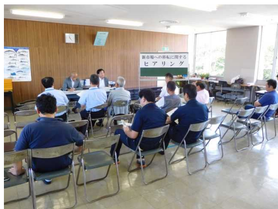
（移転に関するヒアリングの様子）