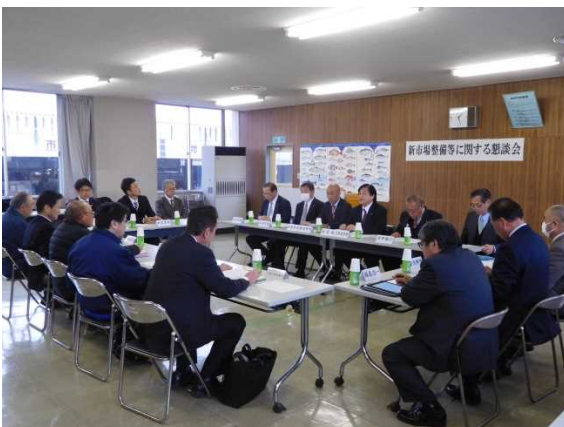
（市場関係者との懇談会の様子）