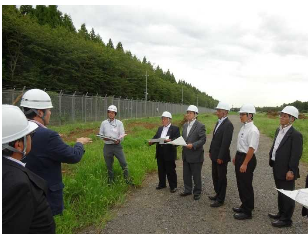
( 新市場用地 視察の様子 )