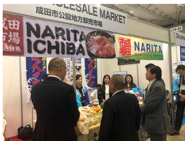
( 「日本の食品 輸出 EXPO」の様子 )