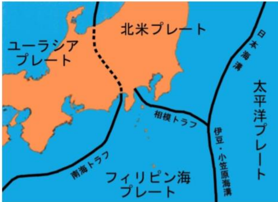
図 3.2.1 関東周辺のプレート境界

図 3.2.1、図 3.2.2 で示すとおり、成田市を含む南関東の地下は複雑な構造をしていると言われており、北米プレート、フィリピン海プレート、太平洋プレートが重なって沈み込んでいる。このため、それぞれのプレート境界およびプレートの内部で様々なタイプの地震が発生している。